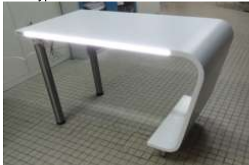
Prototype de meuble / Bureau avec LED